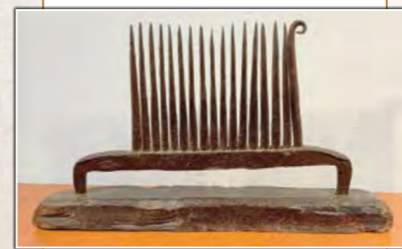
Peine para efectuar el ripado

Tanto las semillas, como el aceite de linaza que contienen, eran muy apreciadas por sus propiedades medicinales y cosméticas, ya que combaten el estreñimiento, ayudan a cicatrizar las heridas y suavizan la piel y el cabello.