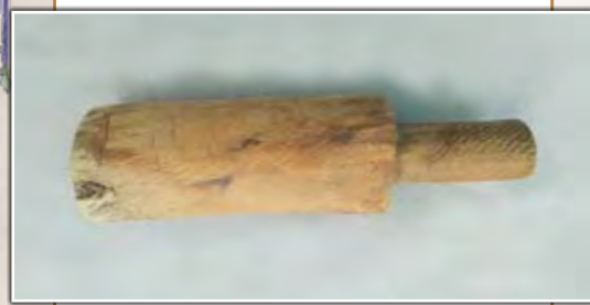
Mazo de madera

Después del ripado se procede al enriado , sumergiendo los haces en agua durante nueve o diez días. En estas condiciones se produce un proceso de curado o fermentación que separa las fibras de celulosa de las materias leñosas. Posteriormente se dejan secar al aire y se procede al mazado ; es decir, a golpear los tallos con fuertes mazos de madera para romper las capas duras de lignina que recubren las fibras.