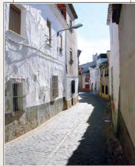
La actual Calle de la Hoz, cuyo trazado era parte del cimiento de la vieja muralla que se levantó a mediados del siglo XIV en Manzanares.

De las cuatro tapias que se debían hacer en aquellos cuatro años, se hizo el cimiento de cal y piedra el primer año (1353) y la primera tapia durante el segundo año (1354), pero después, todo hace suponer que se abandonó la obra de amurallado defensivo, pues ningún resto de almena, muro o saetera ha quedado hoy día, solo el nombre de “la monda”, que significaba “zócalo limpiado”, nombre que debió darse cuando se levantó el cimiento del zócalo. Ésta monda marca el perímetro que tuvo el pueblo de Manzanares desde mediados del siglo XIV y que recorría las actuales Calle de la Iglesia, Calle de la Hoz, Calle Antonio Iniesta, Plaza de Santa Cruz, Calle Pizarro, Calle del Carmen, Calle Pajarón, esquina balconcillo del Santo, Calle Virgen de la Esperanza y Calle Empedrada, hasta empalmar de nuevo con la Calle de la Iglesia, siendo la monda del mismo ancho que las murallas del castillo, es decir, de unos 2 metros. El levantamiento del zócalo de la muralla se debió llevar a cabo a mediados o finales del siglo XIX, pues los mandos franceses del ejército de Napoleón si que citan aún en sus correos la existencia de un antepecho o murete de la altura de un hombre y que éste fue utilizado como parapeto en el año 1808.