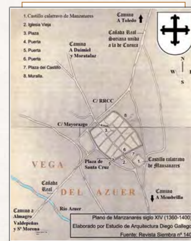
Plano de Manzanares, en la segunda mitad del siglo XIV