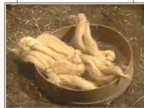
Mechones para hilar

peine de púas metálicas. De esta forma se separan y alinean las fibras a la vez que se seleccionan varios tipos: Las más largas y finas se dedican a la confección del vestuario. Las de peor calidad (estopa) se destinan a la fabricación de costales y lonas bastas.