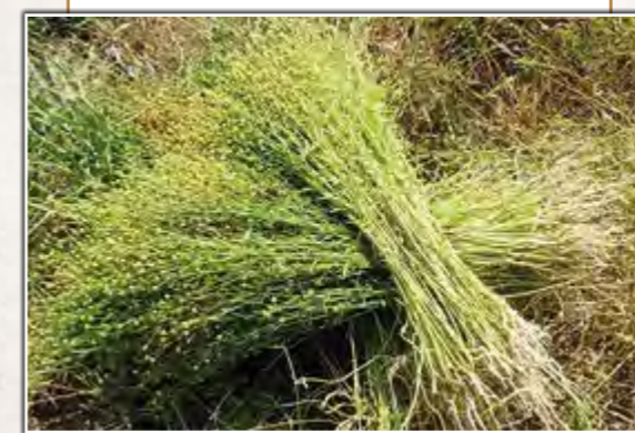
Haces de lino

El lino ( Linum usitatissimum ) es una planta herbácea cuyas fibras ya utilizaron las primeras civilizaciones de Mesopotamia. En Egipto los tejidos de lino se usaban para tejer sábanas, toallas, túnicas y lienzos para envolver las momias. Durante la Edad Media se siguió utilizando para confeccionar ropa interior, sayos, camisas y prendas del ajuar doméstico.