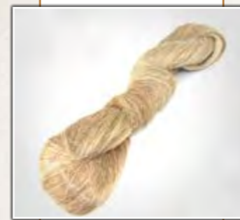
Madeja de lino