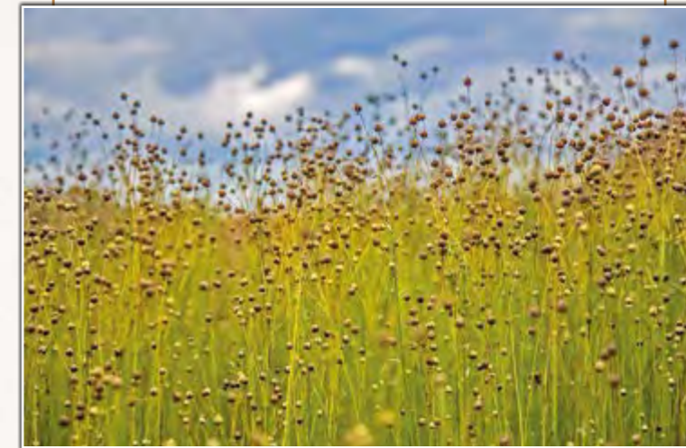
Cultivo de lino

El lino ( Linum usitatissimum ) es una planta herbácea cuyas fibras ya utilizaron las primeras civilizaciones de Mesopotamia. En Egipto los tejidos de lino se usaban para tejer sábanas, toallas, túnicas y lienzos para envolver las momias. Durante la Edad Media se siguió utilizando para confeccionar ropa interior, sayos, camisas y prendas del ajuar doméstico.